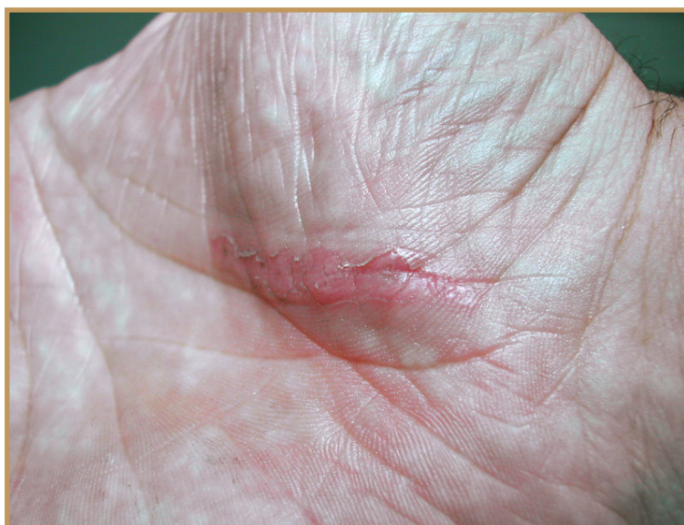
5. června 2015