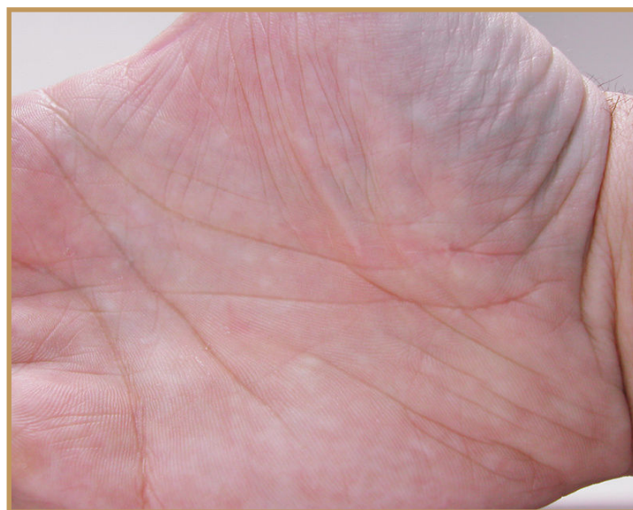
30. června 2015

Víc informací o kosmetice GERnétic na www.gernetic.cz