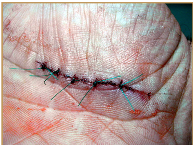
21. května 2015

Výsledek hojení jizvy při použití přípravku SYNCHRO Řezná rána na pravé dlani. Aplikace krému v průběhu 1 měsíce.